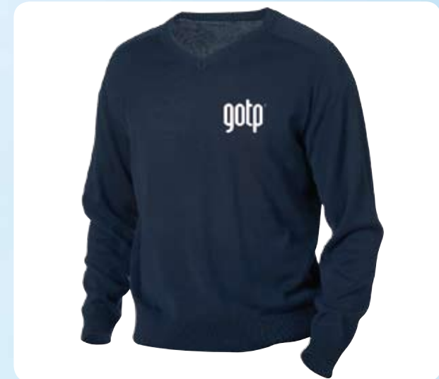
Pullover und Pullunder

Sie erhalten bei uns auch alle gängigen Marken Polos. Gerne besticken wir auch Ihre angelieferten Artikel Preise auf Anfrage.