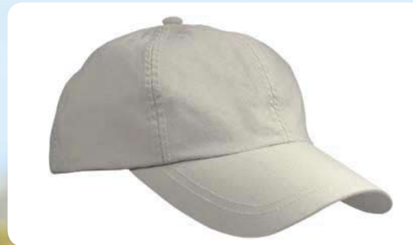
6 Panel Outdoor-Sports-Cap mit Achievetex®