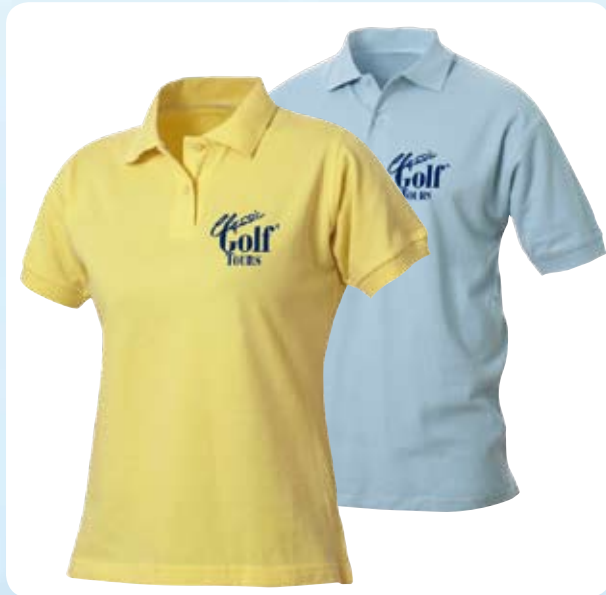
Sports Polo-Shirt Damen und Herren