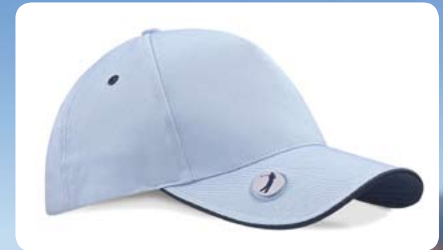
Pro-Style Ball Mark Golf Cap