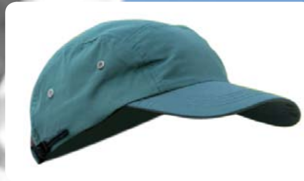
SG707 Microfaser Cap