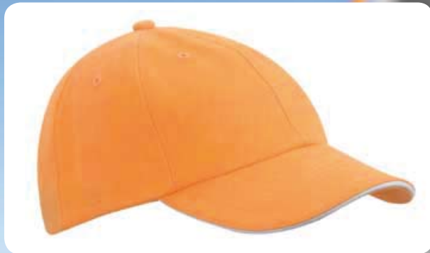
6 Panel Raver Sandwich Cap